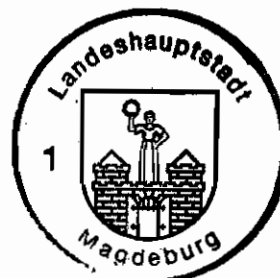
Landeshauptstadt Magdeburg Dienstsiegel