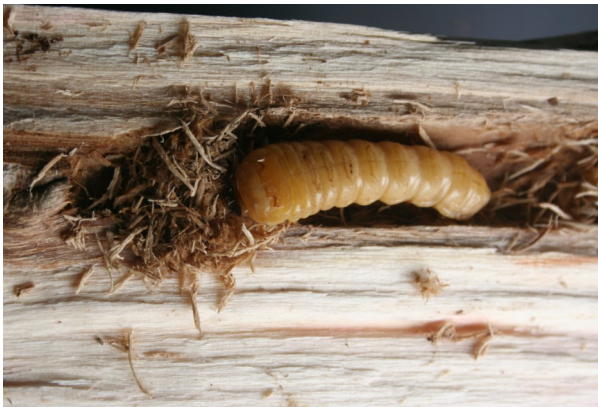
ALB-Larve im Fraßgang mit Bohrspänen

Befruchtete Weibchen legen 30 bis 200 Eier in mehreren Schüben einzeln in Eitrichter unter der Rinde ab. Nach dem Schlüpfen bohren sich die Larven in das Holz. Hier benötigen die Larven unter europäischen Bedingungen eine Entwicklungszeit von ca. zwei Jahren. Nach der Verpuppung bohren sich die Käfer mit den charakteristischen Ausbohrlöchern ins Freie und führen einen Reifungsfraß an der Rinde von kleinen Kronenzweigen oder auch an Blattstielen durch.