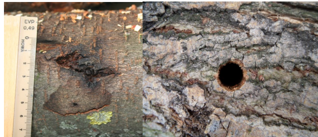
Eiablagestelle (li.) und Ausbohrloch (re.)