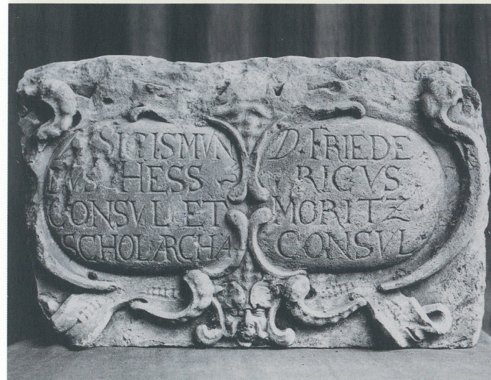
Wappenstein der Bürgermeister Sigismund Hess und Friedrich Moritz von 1618