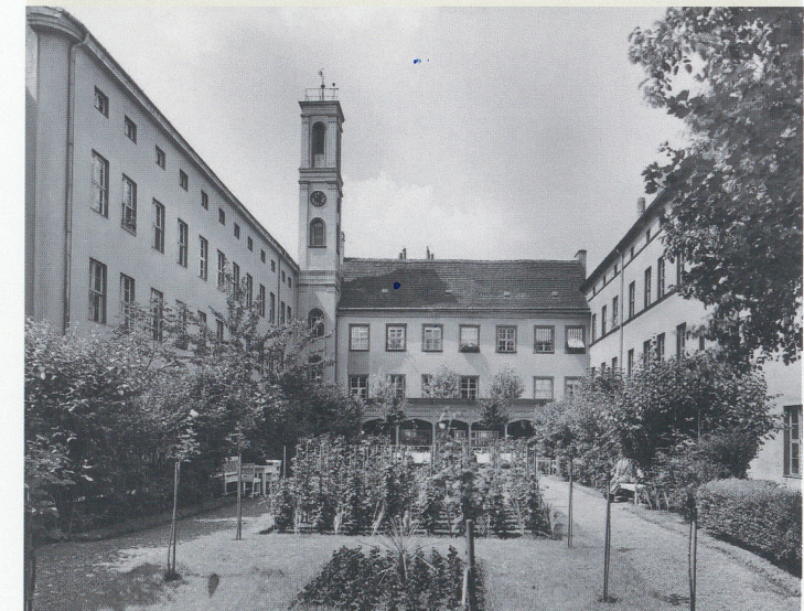
Innenhof des Hospitals St. Georgii in der Stiftstraße 1, 1938