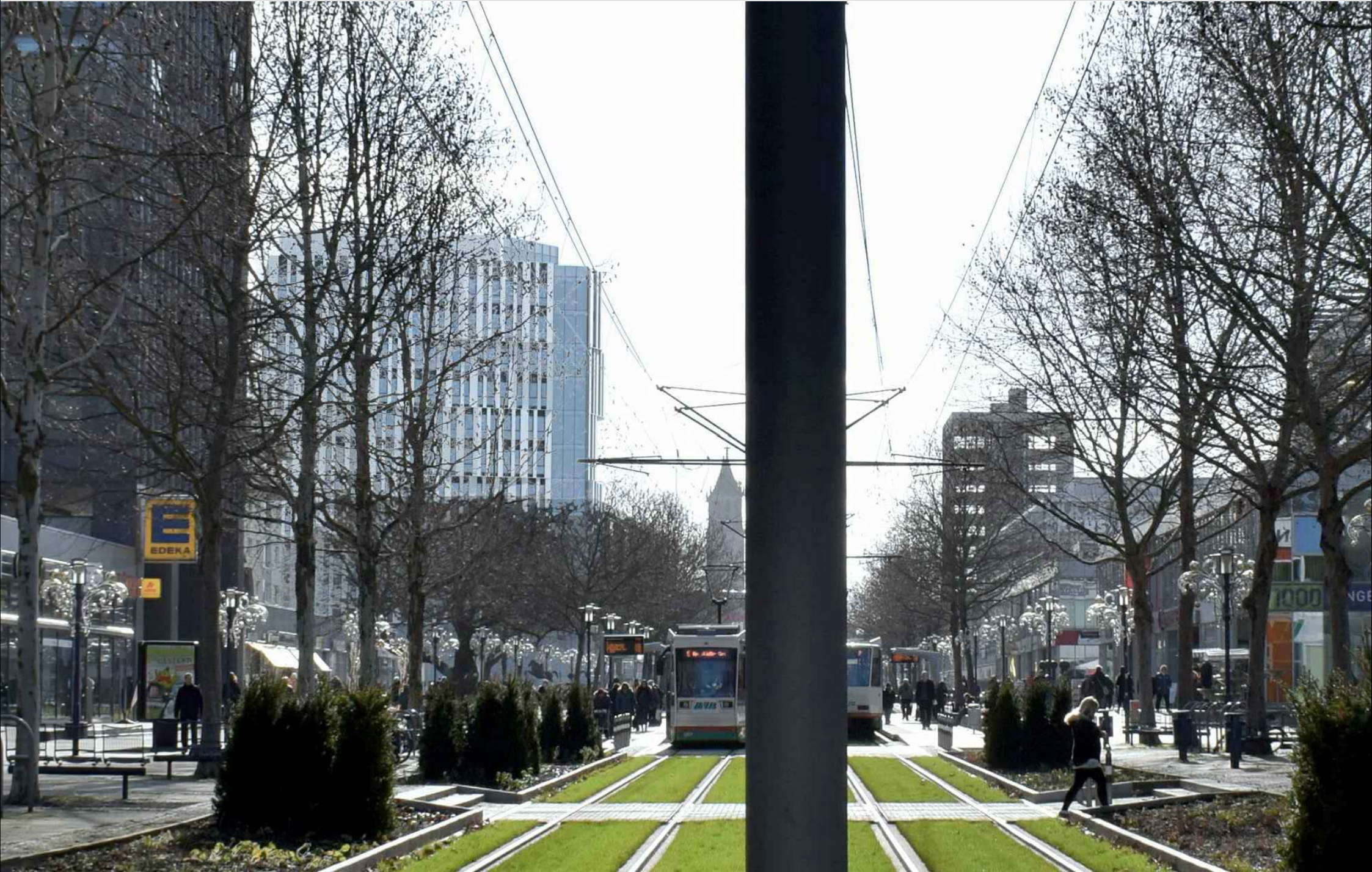
Neubau Breiter Weg / Julius-Bremer-Straße Toepel Projekt Breiter Weg GmbH & Co. KG Stand: 17.09.2020