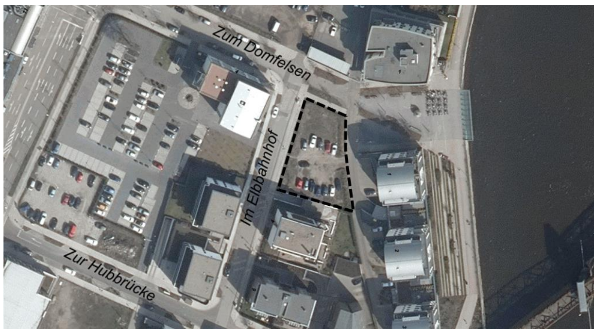
Luftbild 2018

Das bislang unbebaute Flurstück des Änderungsbereiches wird derzeit als Parkplatz genutzt. Die umliegenden Gebäude stellen sich als Wohn- und Geschäftshäuser dar. Die gewerblichen Nutzungen beschränken sich auf Büros sowie gastronomische Einrichtungen.