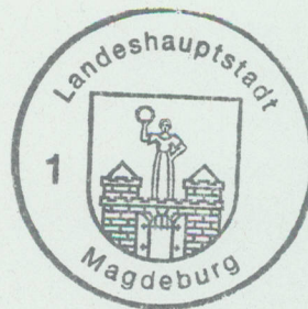
Landeshauptstadt Magdeburg Dienstsiegel