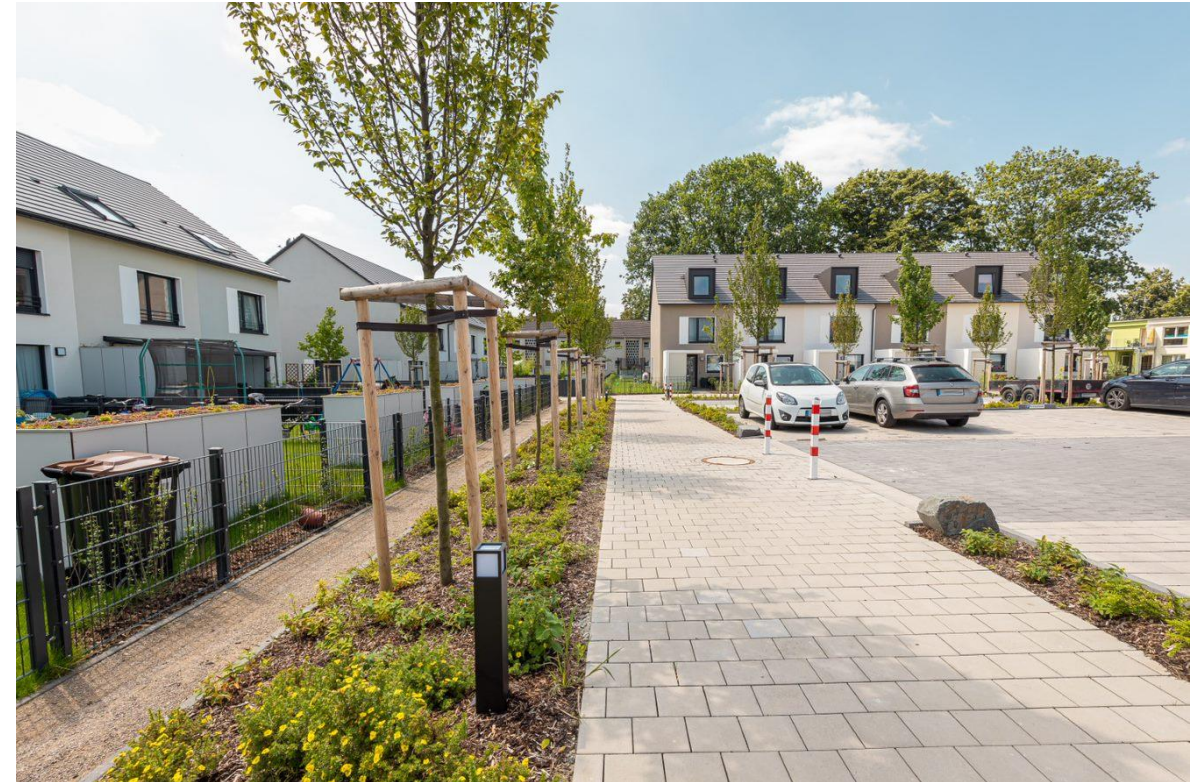
Beispielbilder Erschließung/Stellplätze aus vergleichbaren Wohnparks