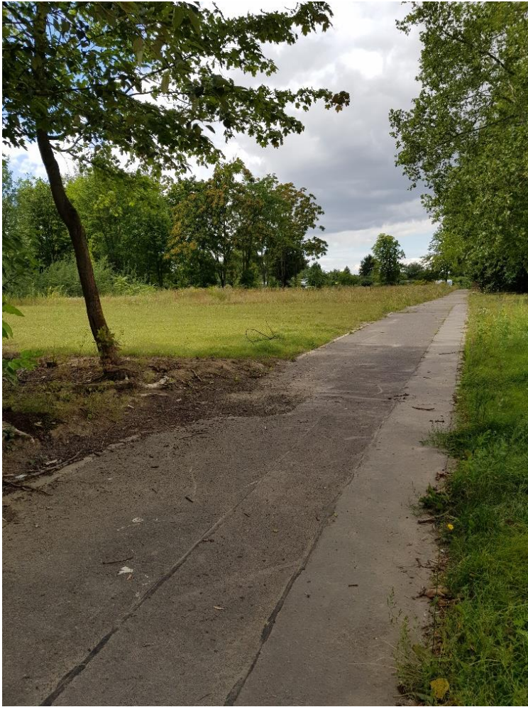
Durchwegung (Sommer 2022)