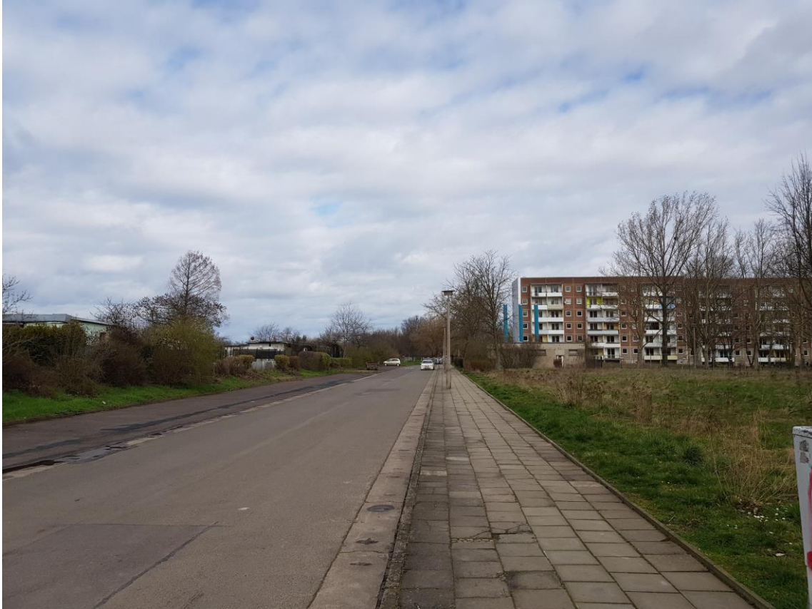
Astonstraße (März 2020)