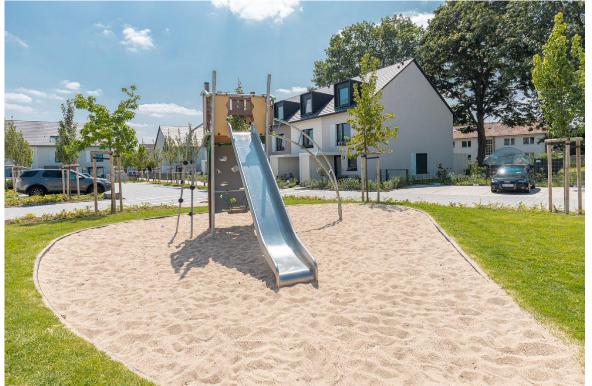
Beispielbilder Spielplätze aus vergleichbaren Wohnparks