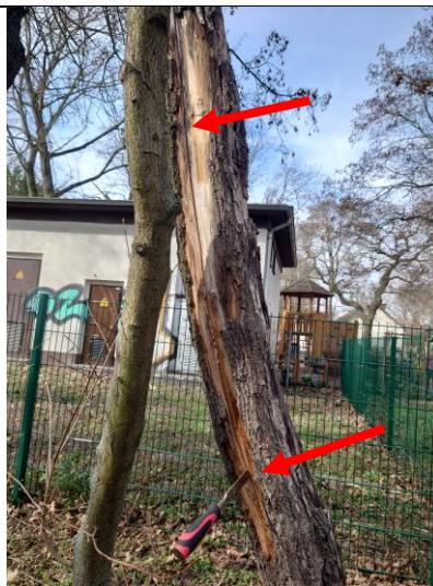
Stammriss mit roten Pfeilen markiert