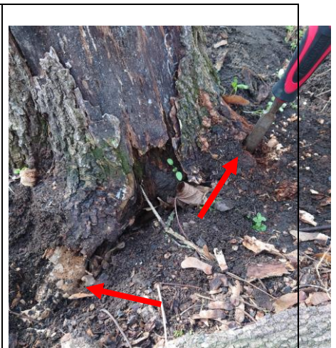
Wurzeln morsch (rote Pfeile)