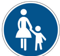
Verkehrszeichen 239 Verkehrssatzzeichen 1022-10

Mit dieser Beschilderung ist das Radfahren in Fußgängerbereichen gestattet.