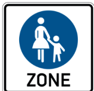
Verkehrszeichen 242 Verkehrssatzzeichen 1022-10