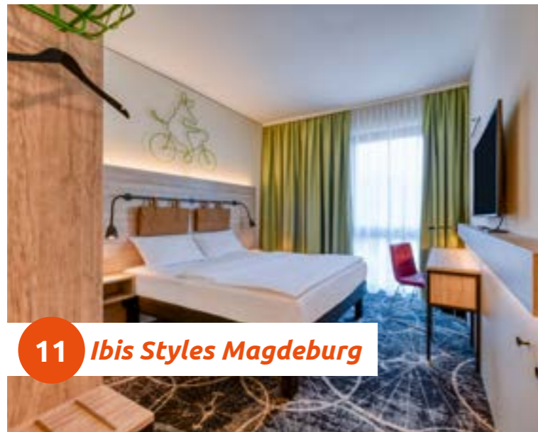
11 Ibis Styles Magdeburg

Das zentrale Hotel ist nur 15 Gehminuten von Hauptbahnhof, Altstadt und Elbpromenade entfernt. Der Elberadweg, Deutschlands beliebtester Radweg, führt durch Magdeburg. Dank der Nähe zu Sehenswürdigkeiten und Einkaufszentren bietet sich das Ibis Styles Magdeburg als Zwischenstopp an. So lassen sich Sport, Shopping und Sightseeing ideal verbinden.