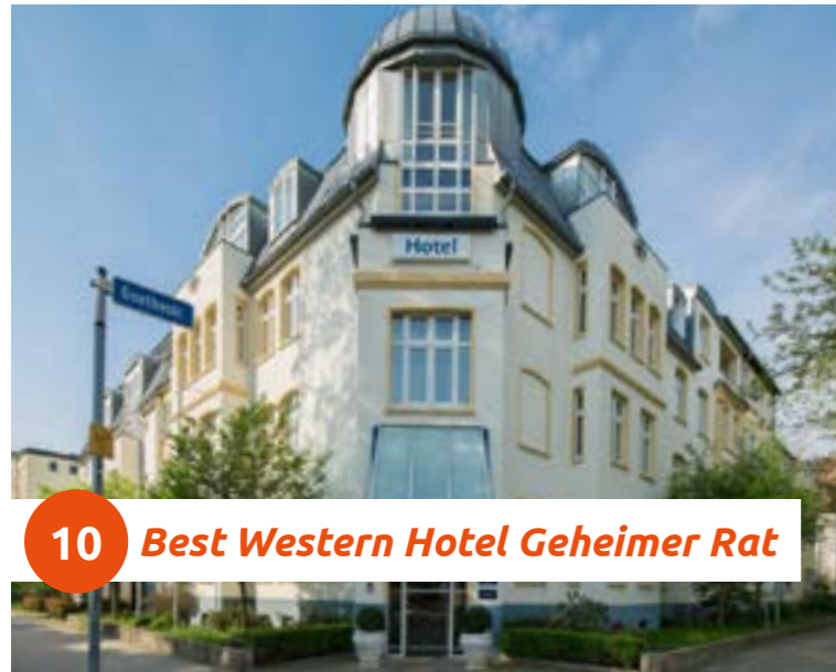
10 Best Western Hotel Geheimer Rat

Im Herzen der schönen Ottostadt Magdeburg, in einer parkähnlichen Allee, liegt das familiär geführte Best Western Hotel Geheimer Rat. Schon beim ersten Eintreten in unser Hotel bestechen Foyer und Gasträume durch ihre persönliche Note. Das ideale Hotel für kleine Seminare oder Tagungen. Persönliche Betreuung und individueller Service werden hier groß geschrieben.