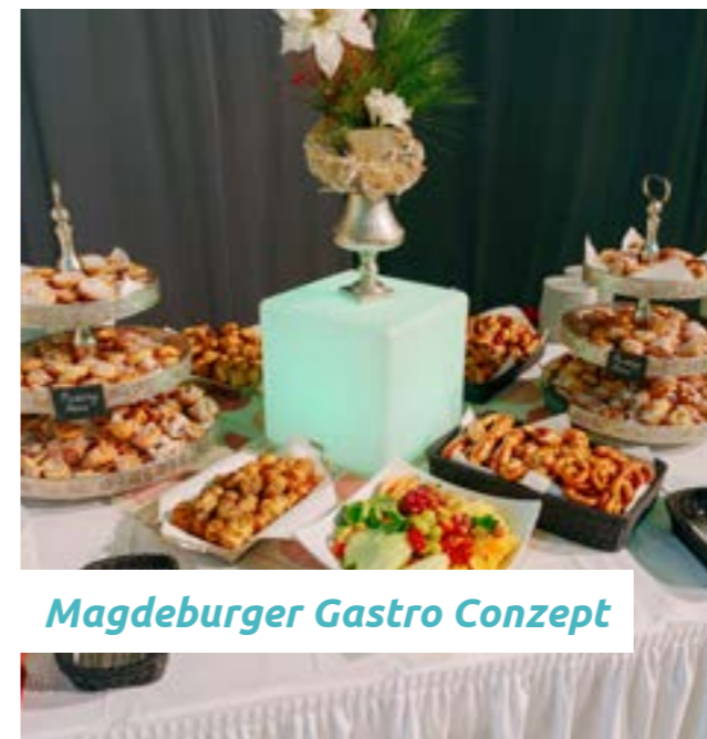
Magdeburger Gastro Konzept

Wir sind Spezialist für innovative Eventorganisation und bieten Full-Service rund um Ihre Veranstaltung. Ideenreich und mit Liebe zum Detail planen wir außergewöhnliche Events, Feste, Märkte und Konzerte. Darüber hinaus bieten wir maßgeschneiderte IT-Lösungen für jede Veranstaltung. Events mit Esprit.