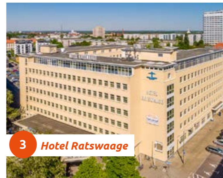
3 Hotel Ratswaage

Zentraler kann man nicht tagen. Die Veranstaltungsräume bieten viel Tageslicht, regelbares Raumlicht und Klimatisierung. Durch flexible Trennwände kann Raum für kleine Gesellschaften bis hin zu großen Konferenzen geschaffen werden. Das Küchenteam sorgt dafür, dass Ihre Gäste auch kulinarisch auf nichts verzichten müssen.