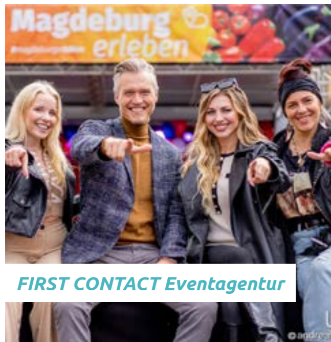
FIRST CONTACT Eventagentur

Unser Ziel ist es, dass Ihre Veranstaltung auch kulinarisch ein köstlicher Erfolg wird und Ihren Gästen noch lange in Erinnerung bleibt! Die Qualität unserer Speisen zeichnet sich eine feine Auswahl regionaler und saisonaler Produkte aus.