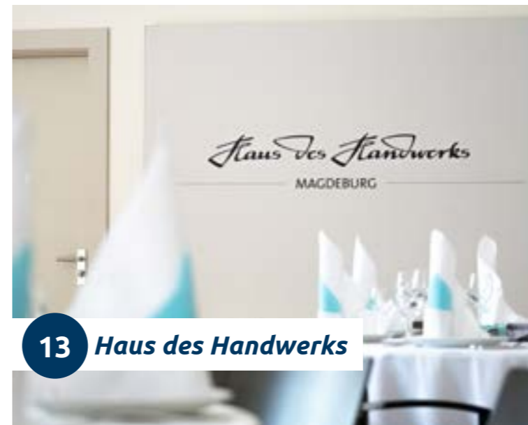
13 Haus des Handwerks

Das traditionsreiche Haus des Handwerks in Magdeburg bietet einen Veranstaltungsraum mit einer Grundfläche von 187 m 2 und kann in drei separate Veranstaltungsräume aufgeteilt werden. Hochmoderne und klimatisierte Tagungsräume mit Medien-Ausstattung auf dem aktuellen Stand der Technik, z. B. Beamer, Headset, Handmikrofon und Rednerpult, lassen keine Wünsche offen.