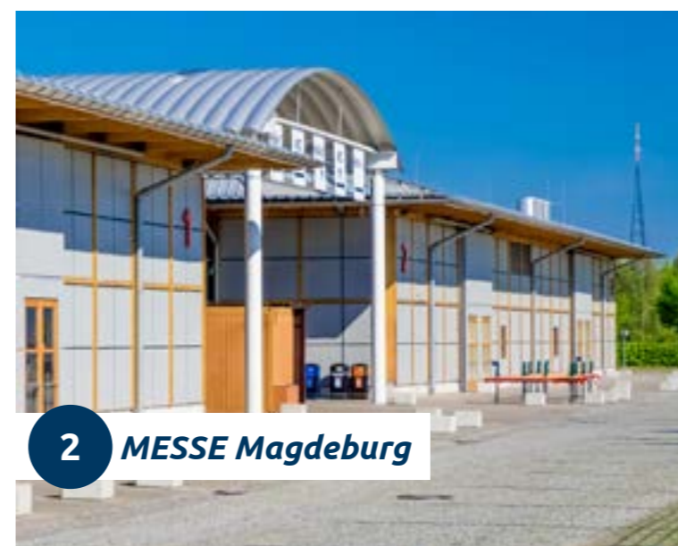
2 MESSE Magdeburg

Die Hallen inklusive der überdachten Freiflächen auf dem 12.000 m 2 großen Gelände des Ausstellungszentrums der MESSE MAGDEBURG bieten moderne technische Ausstattung kombiniert mit Funktionalität durch flexible Raumgestaltung. Die MESSE MAGDEBURG stellt den größten Veranstaltungskomplex in der Region und bietet damit den perfekten Rahmen für Veranstaltungen jeglicher Art.