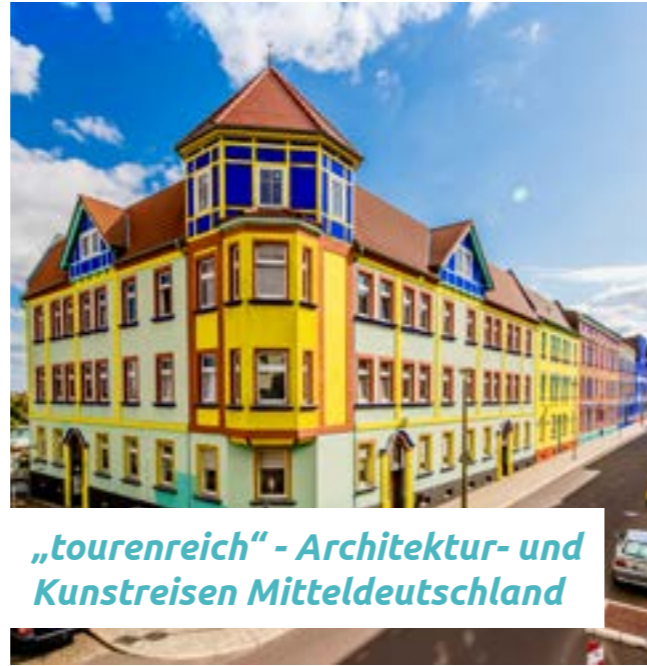
„toureureich“ - Architektur- und Kunstreisen Mitteldeutschland

Der Name ist Programm: Lukullus, ein römischer Feldherr inszenierte seine opulenten Gastmahle durch Musik- und Theaterinlagen. Wir kombinieren besondere kulinarische Genüsse mit musikalischen Einlagen und spannender Stadtgeschichte auf unseren Touren durch die Elbmétropole.