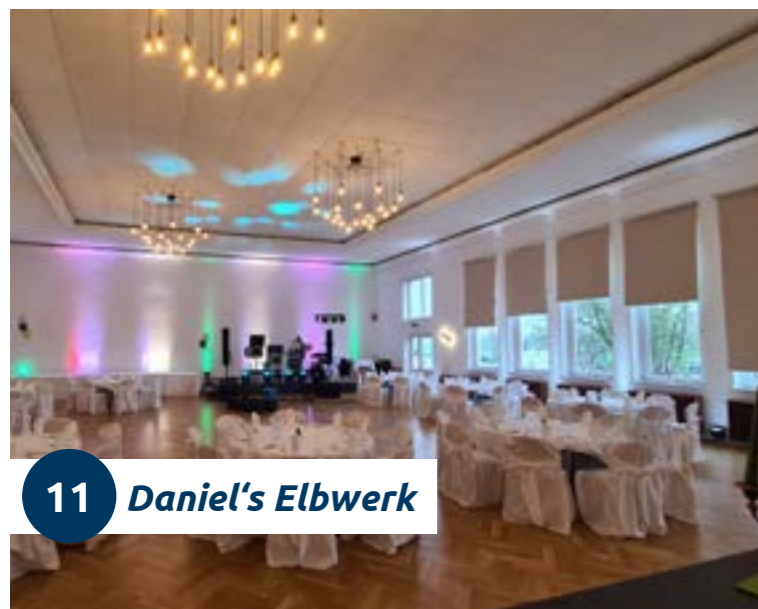
11 Daniel's Elbwerk

Direkt an der Elbe inmitten des Wissenschaftshafens befindet sich das Elbwerk – ideal für Tagungen oder Firmenevents. Für ein unvergessliches kulinarisches Erlebnis werden Küche und Atmosphäre so sorgfältig kombiniert wie Essen und Wein. Genießen Sie den Blick auf die Elbe und den Jahrtausendturm von unserer Außenterrasse. Die Schiffsbar steht für Ihr Event ebenfalls zur Verfügung.