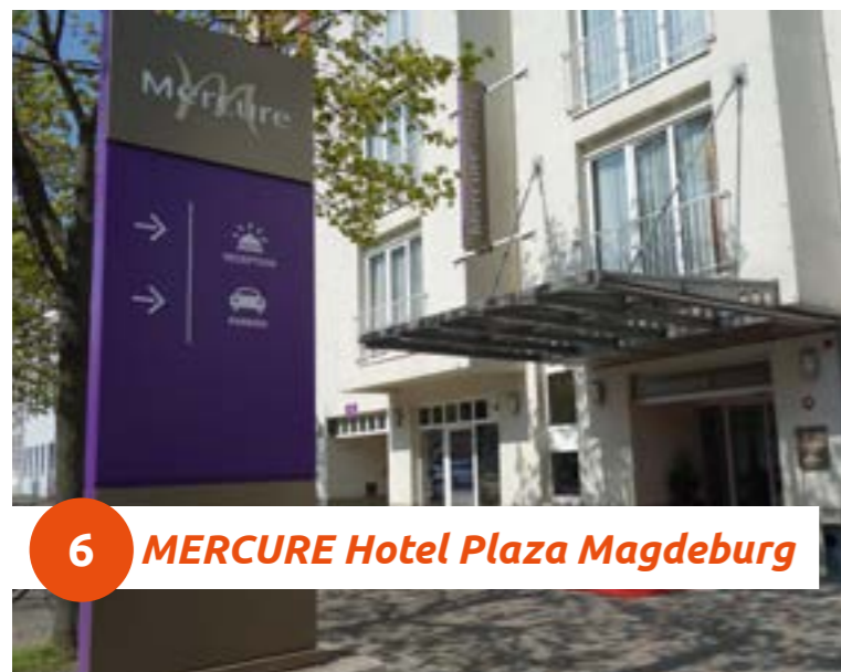
6 MERCURE Hotel Plaza Magdeburg

Unser Mercure Hotel Plaza Magdeburg verfügt über gute Verkehrsanbindungen in die Innenstadt, zum Hauptbahnhof und allen Sehenswürdigkeiten. Unsere Zimmer sind gemütlich eingerichtet. Für Veranstaltungen jeglicher Art stehen unseren Gästen Räumlichkeiten zur Verfügung, ebenso wie unsere Tiefgarage und zahlreiche Parkplätze hinter dem Hotel.