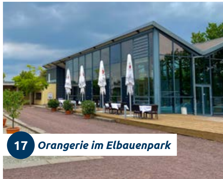
17 Orangerie im Elbauenpark

Großzügige Raumverhältnisse in im Elbauenpark bieten Ihnen die richtige Atmosphäre für Ihre Veranstaltung. Sie suchen eine Eventlocation im Grünen gelegen, modern und trotzdem gemütlich? Dann ist die Orangerie im Elbauenpark genau das Richtige für Ihre Veranstaltung! Durch das moderne Design ist diese Eventlocation et was ganz besonderes.