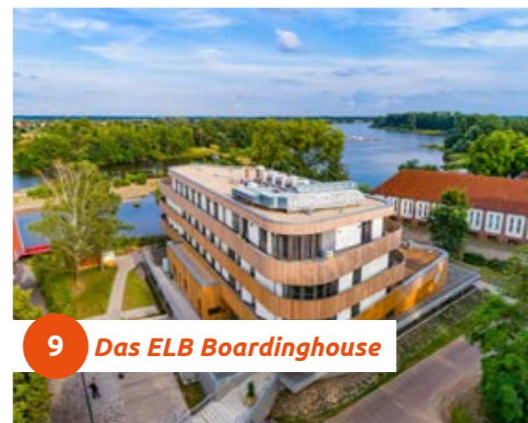
9 Das ELB Boardinghouse

Das Boardinghouse erwartet Sie mit 33 gut ausgestatteten Apartments. Ein schöner Elbblick von den Zimmern und des Restaurants mit internationaler Küche sind inklusive. Freuen Sie sich auf erstklassige Gerichte in anregender Atmosphäre mit Blick zur Elbe. Hier können Sie für eine Weile Ihren Alltagsstress vergessen.