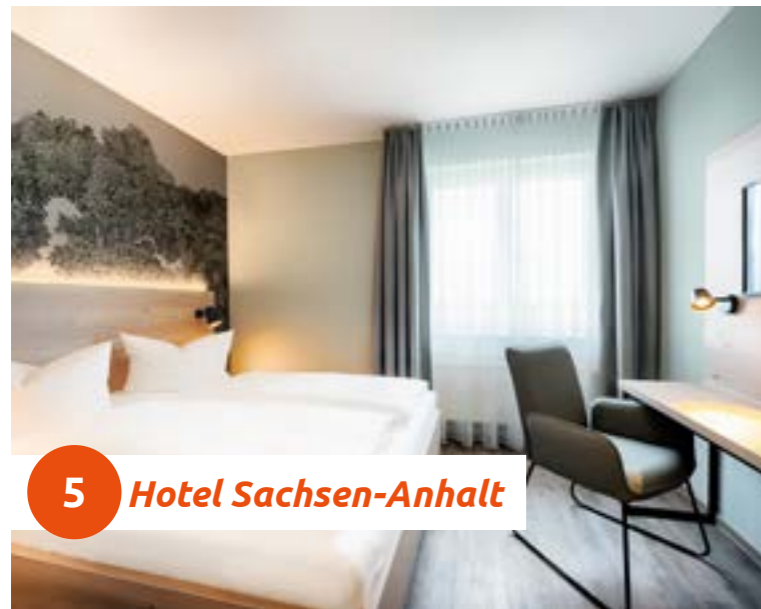
5 Hotel Sachsen-Anhalt

Dieses inhabergeführte Business-Hotel in Barleben verfügt über eine gute Anbindung an die A2 und A14 und dennoch ist das Zentrum Magdeburgs innerhalb von 15 Minuten zu erreichen. Die 118 modernen Zimmer laden zu einem entspannten Aufenthalt ein. Der großzügige Parkplatz ist kostenfrei.