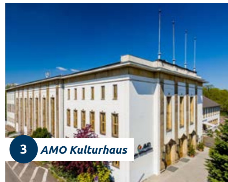
3 AMO Kulturhaus

Mitten im Stadtkern und doch im Grünen, umgeben von einem 100-jährigen Park, unweit des Klosterberggartens und der Grusonschen Gewächshäuser, bietet sich das AMO Kultur- und Kongresshaus als multifunktionale Location für Shows, Konzerte, Bälle, Präsentationen und Tagungen an. Beliebt ist das Haus für Veranstaltungskombinationen auf allen drei Ebenen.