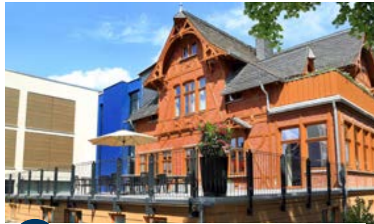
16 Rayonhaus der Lebenshilfe Magdeburg

Neben einem großen historischen Raum steht Ihnen auch eine separate Lounge und eine Sonnenterrasse zur Verfügung. Es sind nicht nur die Details, wie die liebevoll restaurierten Holzdecken und die geschmackvolle Innenausstattung, die Sie begeistern werden. Neben schmackhaften Speisen bieten wir Ihnen flexible Bestuhlungsmöglichkeiten und moderne Tagungstechnik.