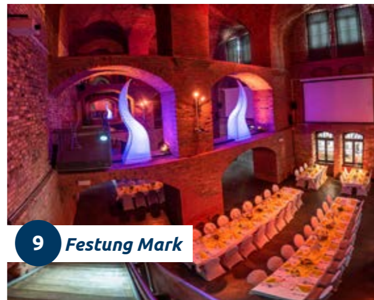
9 Festung Mark

Die moderne Event-Location in historischen Gewölben. Einst Teil der größten preußischen Festung ist die Festung Mark heute ein vielfältiges Kultur- und Tagungszentrum in Elbnähe direkt im Herzen der Stadt. Mächtige elf Meter hohe Gewölbe und ein großer Festungshof bilden heute die Kulisse für einzigartige Veranstaltungen. Unterschiedliche Räumlichkeiten, exklusive Ausstattung und viel Erfahrung bieten den idealen Platz für Ihre Wunschveranstaltung.