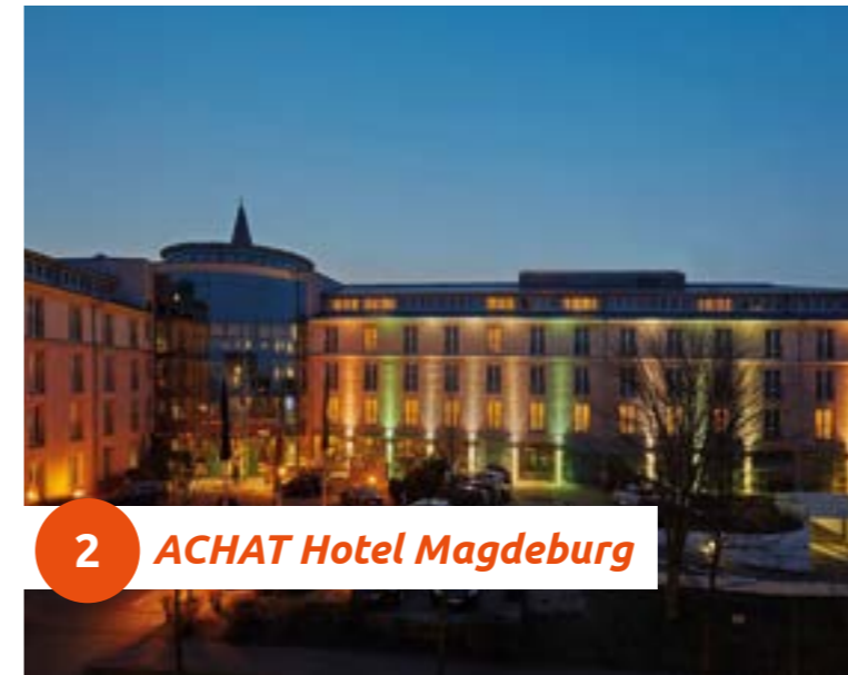
2 ACHAT Hotel Magdeburg

Das Achat Hotel Magdeburg ist die ideale Basis für Ihre Tagung. 9 variable und klimatisierte Tagungsräume sind mit Tageslicht und moderner Tagungstechnik ausgestattet. Flexible Trennwände schaffen Raum für kleine Arbeitsbesprechungen oder für Ihre Großveranstaltung. Speziell für Großveranstaltungen wurde ein Saal konzipiert, der 500 Personen Platz bietet.