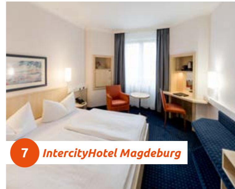
7 IntercityHotel Magdeburg

Direkt am Hauptbahnhof gelegen kann man kaum zentraler tagen. Unsere Konferenzräume mit Tageslicht & moderner Veranstaltungstechnik bieten zudem das richtige Ambiente. Durch unsere vielfältigen Angebote erhalten Sie auf jede Anfrage ein komplett individuelles Angebot. Und das Beste: Durch unser Green-Meeting Konzept werden die Auswirkungen auf die Umwelt möglichst gering gehalten.