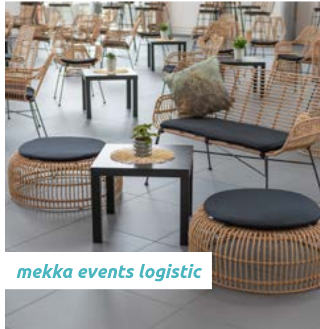
mekka events logistic

Wir sind Ihr Experte für eine vielseitige Auswahl an Mietmöbeln, Eventausstattung, Absperrentechnik und Zelten. Das Engagement für Qualität, professioneller Service und die Leidenschaft für Events machen die mekka events logistic zum idealen Partner für Ihre nächste Veranstaltung.