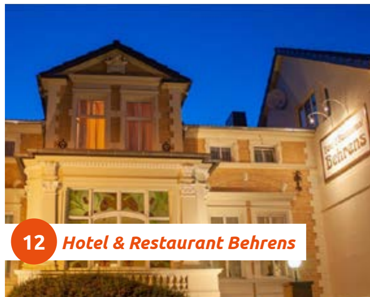
12 Hotel & Restaurant Behrens

Unser Haus mit seiner gemütlichen Atmosphäre ist eine der ersten Adressen in Haldensleben. Die Jugendstilvilla wurde 1892 erbaut, umfassend renoviert und modern ausgestattet. Das Hotel-Restaurant verwöhnt mit kulinarischen Köstlichkeiten der internationalen und deutschen Küche aus frischen, regionalen Produkten.