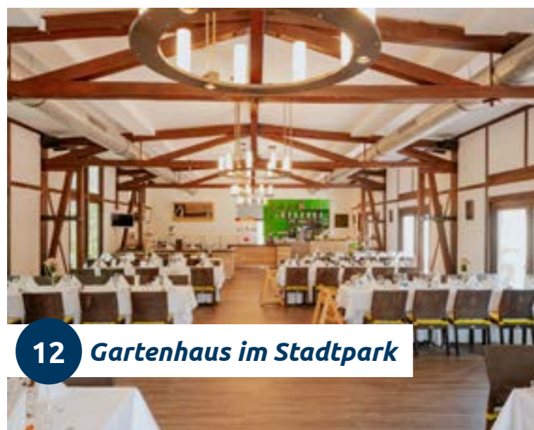
12 Gartenhaus im Stadtpark

Das Gartenhaus bietet Ihnen eine ruhige, angenehme Atmosphäre mitten in der Natur von Magdeburg. Das Objekt verfügt über eine optimale technische Ausstattung mit einem großzügig ausgebauten, eingezäunten Terrassenbereich. Die gastronomische Versorgung, Planung der Veranstaltung und eventuelle Organisation eines Rahmenprogramms übernimmt der hauseigene Caterer.