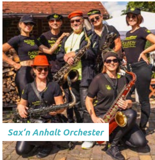
Sax'n Anhalt Orchester

Wir unterstützen Sie dabei, ein attraktiver Arbeitgeber zu bleiben. Unsere Angebote tragen dazu bei, das „Wir-Gefühl“ im Team zu stärken. Bei uns wie auch in jedem Unternehmen ist Zusammenarbeit und Kommunikation der Schlüssel zum Erfolg, so schaffen wir gemeinsame und unvergessliche Erlebnisse.