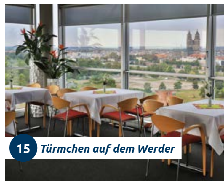
15 Türmchen auf dem Werder

Die Möglichkeit individuell, komfortabel, exklusiv und in einem atemberaubenden Ambiente zu feiern, bietet Ihnen das Türmchen auf dem Werder. Nutzen Sie die Gelegenheit aus etwa 50 Metern Höhe den wunderschönen Panoramablick über die Landeshauptstadt Magdeburg zu genießen und auf der Dachterasse zu verweilen. Das Türmchen ist ideal für Familien- und Firmenfeiern, Tagungen und Seminare.