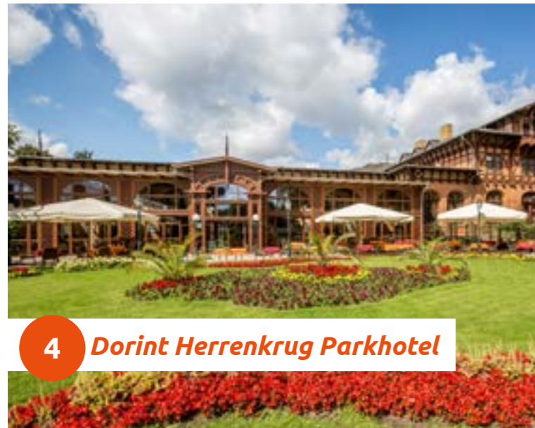
4 Dorint Herrenkrug Parkhotel

Das Dorint Herrenkrug Parkhotel Magdeburg liegt direkt am malerischen Elbufer im Herrenkruggpark. Hier reiht es sich mit seinem detailreich restaurierten Jugendstil in die historischen Einzigartigkeiten der Stadt ein. Behagliche Zimmer, erlesene Gastronomie und eindrucksvolle Veranstaltungsräume harmonisieren miteinander und tragen zu einem erholsamen Aufenthalt bei.