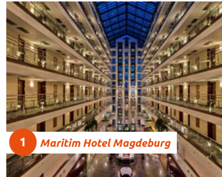
1 Maritim Hotel Magdeburg

Weltoffenes Flair strahlt die imposante 32 m hohe Galerie im Maritim Hotel Magdeburg aus. Das zentral in der mehr als 1.200-jährigen Ottostadt an der Elbe gelegene Maritim Hotel Magdeburg ist nur 200 m vom Hauptbahnhof entfernt und bietet mit 514 Zimmern sowie 18 Tagungsräumen vielfältige Möglichkeiten für Ihre privaten oder geschäftlichen Anlässe.