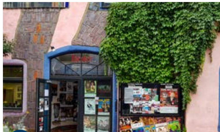
10 Theater in der Grünen Zitadelle

Das Theater in der Grünen Zitadelle ist das einzige Theater weltweit, das sich in einem Hundertwasserhaus befindet. Neben Theater, Comedy und Shows steht der klimatisierte Theatersaal mit seinem besonderen Ambiente auch als Tagungs- und Veranstaltungsraum zur Verfügung. Größe und Ausstattung sind flexibel gestaltbar.