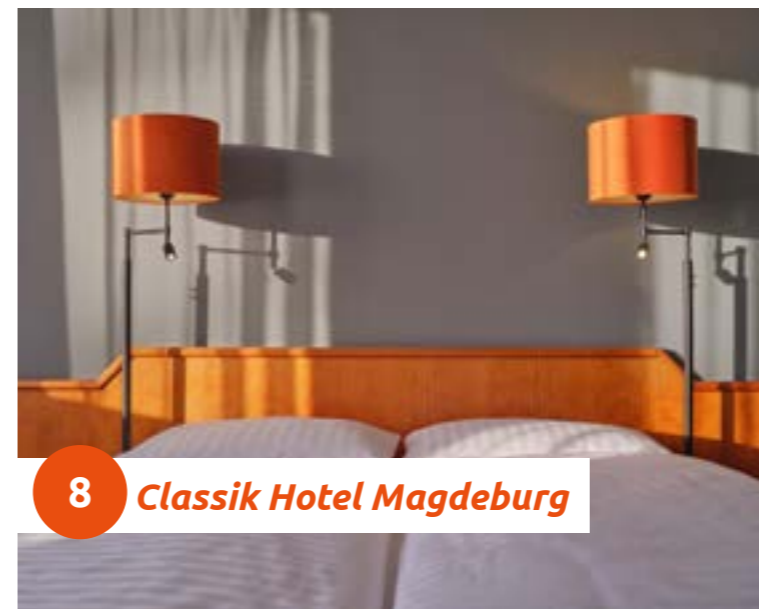
8 Classik Hotel Magdeburg

In unmittelbarer Nähe der Hauptverkehrsachsen ist das Hotel aus allen Richtungen Deutschlands schnell zu erreichen und bietet die perfekte Location und alle Annehmlichkeiten für Ihr nächstes Event. Mit einer Gesamtfläche von fast 300 m 2 bieten unsere Veranstaltungs- und Konferenzräume ausreichend Platz für ein professionelles Get-Together oder die private Feier.