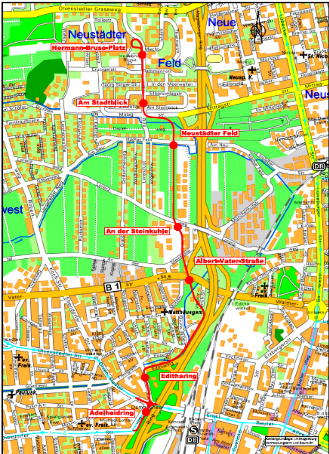
2. Nord-Süd-Verbindung der Straßenbahn in Magdeburg 4. BA - Damaschkeplatz bis Hermann-Bruse-Platz