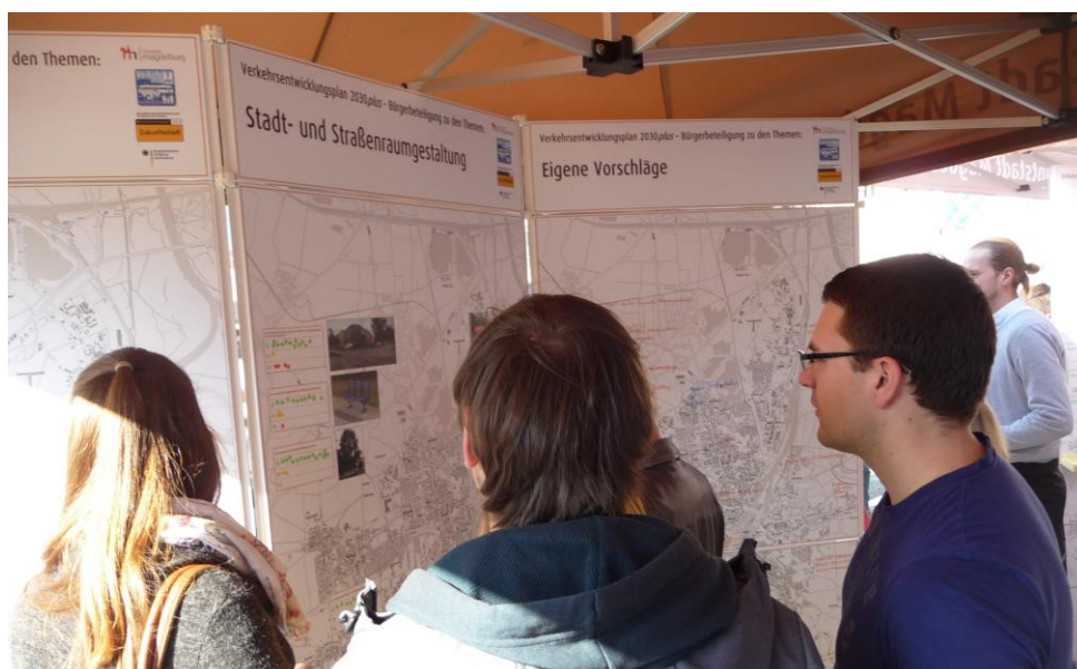
Rathausfest 2015 - Öffentlicher Dialog zum Verkehrsentwicklungsplan 2030plus

Liebe Magdeburgerinnen und Magdeburger, liebe Freunde und Gäste der Stadt,