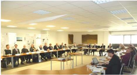
Runde Tisch bei der Erarbeitung des Maßnahmenpaketes

Der Runde Tisch kam im April 2016 zu dessen 11. Arbeitssitzung zusammen. Inhalt der Sitzung war die Vorstellung der Ergebnisse der Öffentlichkeitsbeteiligung sowie der Entwurf des Maßnahmenpaketes.