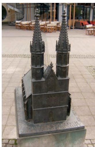
Modell der Ulrichskirche 1

Am 17. Juli 1524 fand der erste lutherische Gottesdienst in der Magdeburger Pfarrkirche (später Ulrichskirche 1 ) statt. Die Kirche wurde 1956 gesprengt.