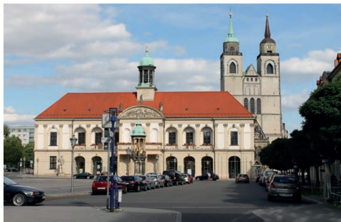
Rathaus und Alter Markt, im Hintergrund - Johanniskirche

Anlässlich des 500. Reformationsjubiläums im Jahre 2017 lädt die Landeshauptstadt Magdeburg Sie zu einer kurzweiligen Fahrradtour auf den Spuren der Reformation ein. Auf Ihrer Radtour besuchen Sie Orte und Stätten an denen die Reformation ihre Spuren hinterlassen hat.