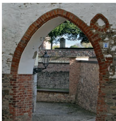
Stadttor im Möllenvogteigarten 8

Luther hatte sie im Jahr 1516 inspiziert und hier am 24. Juni 1524 gepredigt. Im 17. Jahrhundert siedelten sich protestantische Glaubensflüchtlinge aus der Wallonie an und nutzen diese. Nun setzen Sie Ihre Fahrt stromaufwärts, vorbei an den erhaltenen Teil der Stadtmauer, in Richtung Eisenbahntor und Fußgängerbrücke über das Schleifufer fort. Über den Weg der Ottonen gelangt man zum Dom St. Mauritius & Katharina 6 . Interessanterweise blieb der Dom nach 1524 zunächst katholisch. Protestanten griffen daher Mitglieder des Domkapitels an. Der erste lutherische Gottes-Dienst fand 1567 statt. Innerhalb und im Umfeld des Domes laden weitere touristische Sehenswürdigkeiten, wie zum Beispiel der Tetzlkasten 7 als Symbol des von Luther kritisierten Ablasshandels und Möllenvogteigarten 8 zu einem Besuch ein. Möglicherweise wurde das Stadttor von Luther während seines Schuljahres als 14-Jähriger an der Schule „Brüder vom Gemeinsamen Leben“ als Weg zu seiner Unterkunft genutzt. Nachdem Sie Dom und Domplatz hinter sich gelassen haben, erreichen Sie über die Danzstraße den Breiten Weg kreuzend das Kulturhistorische Museum/Naturkundemuseum 9 . Hier kann man wechselnde Dauerausstellungen und Sonderschauen zur Geschichte Magdeburgs erleben. Ihre Fahrt setzen Sie entlang der Otto-von-Guericke-Straße fort und erreichen den Ausgangspunkt Ihrer Tour: Modell der Ulrichskirche .