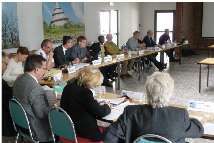
Arbeitssitzung des Runden Tisches

Gleichwohl hat die Projektleitung die Öffentlichkeit über den Fortgang der Bearbeitung des VEP 2030 plus sowie Ergebnisse der Bestandsanalyse und der Leitsätze und Ziele mit (themenspezifischen) Newslettern informiert.