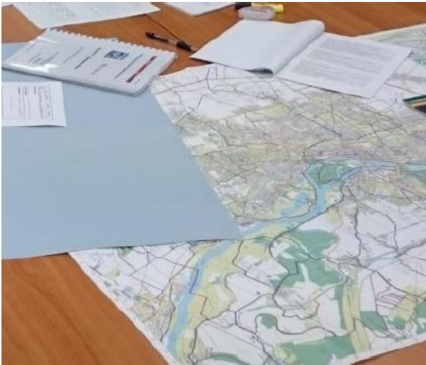
Auswertung der „Ideenblätter“

Die insgesamt 25 "Sowieso-Maßnahmen" lassen sich den vier genannten Kategorien folgendermaßen zuordnen: Neben den drei Vorhaben in der Umsetzung handelt es sich um zwei weitere im Planungsstadium, zehn vom Stadtrat beschlossene sowie weitere zehn zur Prüfung empfohlene Maßnahmen.