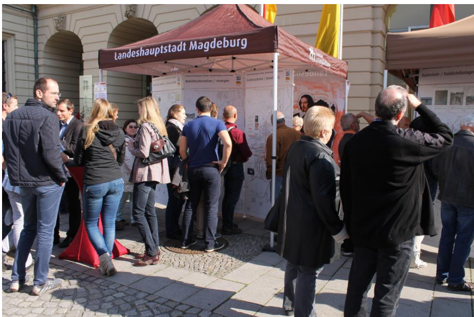
Öffentlicher Dialog zum Verkehrsentwicklungsplan während des Rathausfestes am 03.10.2015

Dies bedeutet allerdings nicht, dass diese Empfehlungen ausschließlich von Fußgängern, Radfahrern oder ÖPNV-Nutzern abgegeben wurden. Vielmehr ist davon auszugehen, dass der überwiegende Teil der am Dialog Beteiligten in der Regel mehrere Verkehrsmittel nutzt.