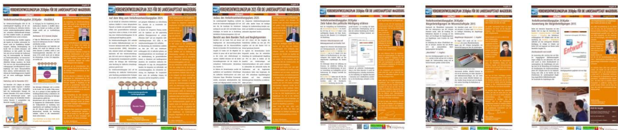
Newsletter zur Erarbeitung des Verkehrsentwicklungsplanes

Einen zweiten, aber nicht weniger bedeutsamen Aspekt der Öffentlichkeitsarbeit stellt die Beteiligung aller Einwohnerinnen und Einwohner der Landeshauptstadt Magdeburgs dar. Zu einem gegebenen Zeitpunkt ist es daher fest eingeplant, die erste Öffentlichkeit am Verfahren zum Verkehrsentwicklungsplan 2025 (später VEP 2030plus) zu beteiligen.