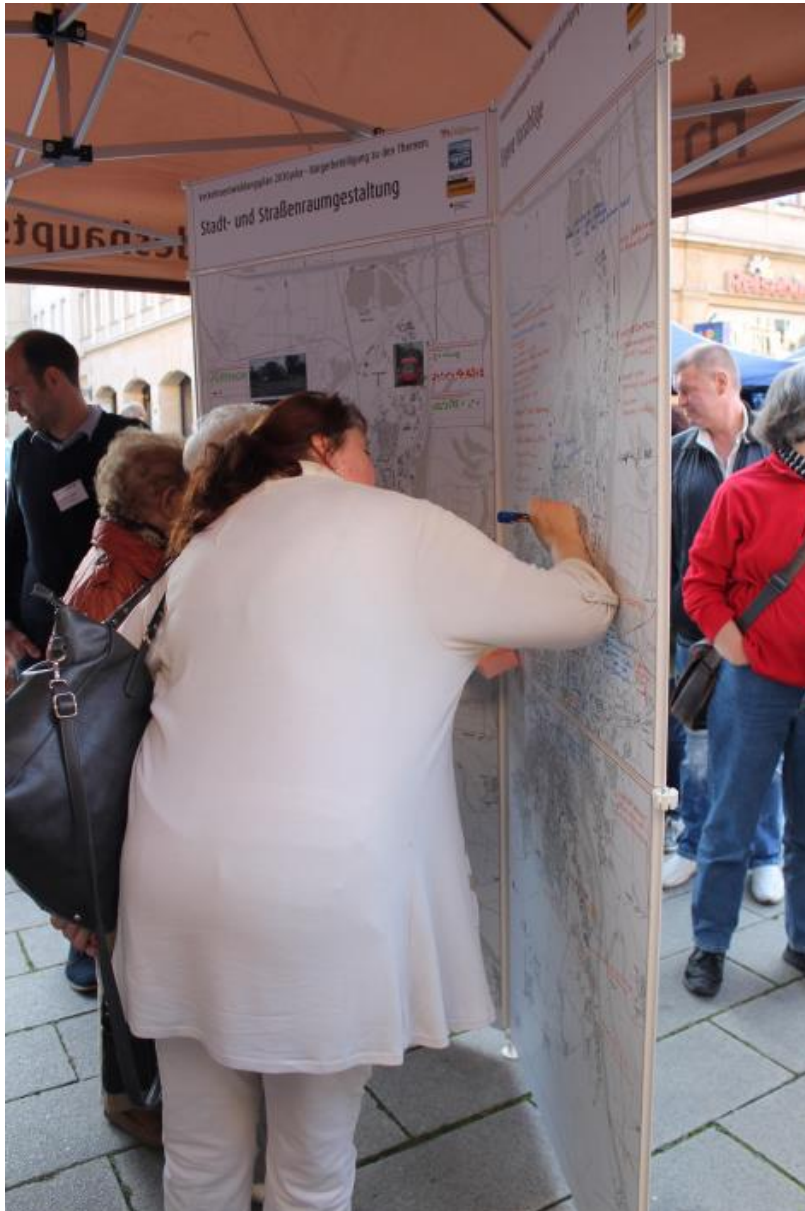
Öffentlicher Dialog - Eigene Vorschläge konnten eingebracht werden

Im Rahmen von Diskussionen zum „Öffentlichen Dialog“ waren natürlich die aktuellen Baustellen (wie bspw. 2. Nord-Süd-Verbindung der Straßenbahn, Eisenbahnüberführung Ernst-Reuter-Allee) und deren Einfluss bzw. Beeinträchtigungen auf die Verkehrsführungen innerhalb der Landeshauptstadt Magdeburg angesprochen worden. Diese Diskussionen mussten im Aufstellungsprozess des Maßnahmenkatalogs ebenfalls bewertet werden bzw. gefiltert werden.