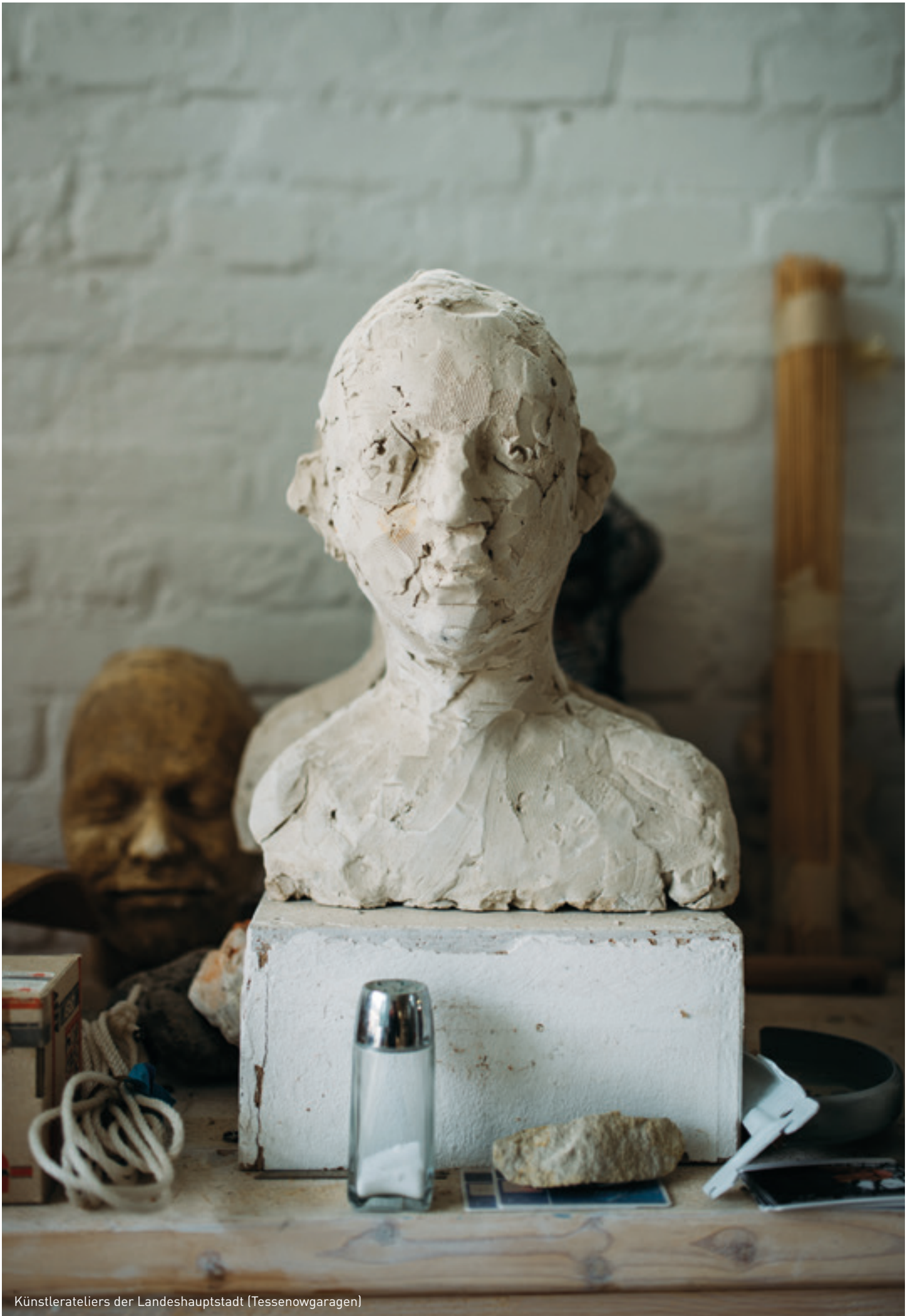
Künstlerateliers der Landeshauptstadt (Tessenowgaragen)