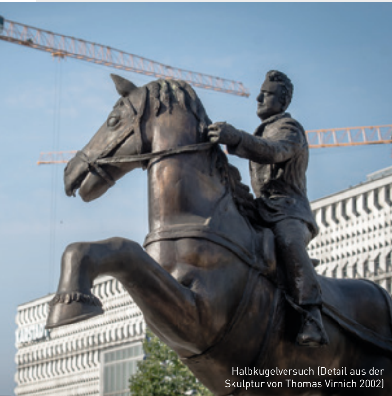
Halbkugelversuch (Detail aus der Skulptur von Thomas Virnich 2002)

Mit der Kulturhauptstadtbewerbung 2025 oder durch neue oder geplante Kulturprojekte (Dom-museum „Ottonianum“, Synagoge, Neugestaltung von Hyparschale, Stadthalle, Technikmuseum, Akademie für Darstellende Kunst und Musik) dokumentiert die Stadt ihr kulturelles Engagement.