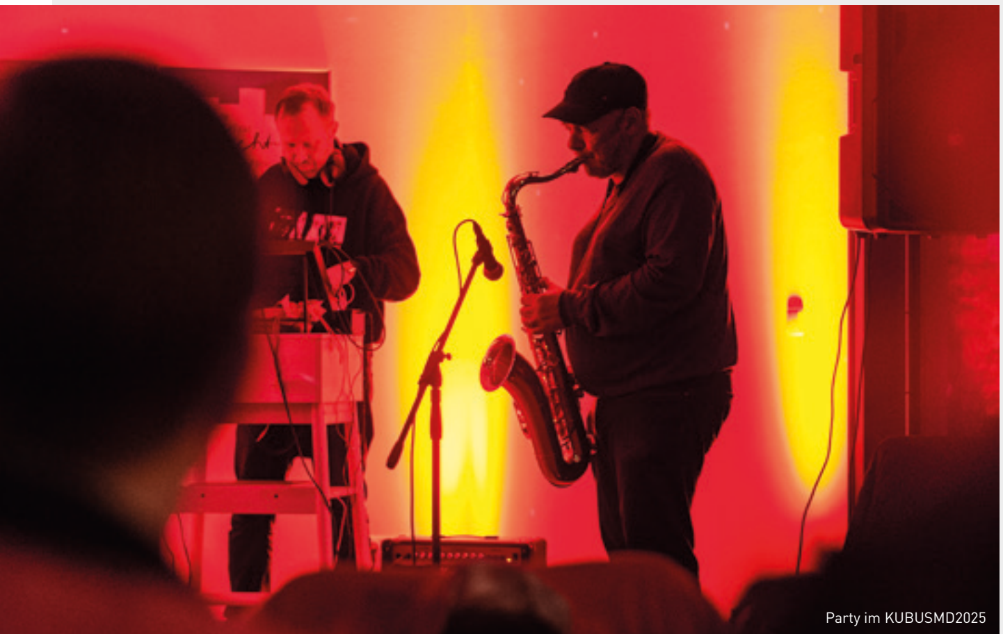
Party im KUBUSMD2025

Diese Aspekte, Analysen und Schlussfolgerungen müssen von einer engagierten Kulturpolitik berücksichtigt werden. Um diese Kulturstrategie zu erstellen, wurden folgerichtig Recherchen über die Stadtverwaltung hinaus durchgeführt. Auch die Strategien und Konzeptionsphasen vergleichbarer Städte wurden hinzugezogen.