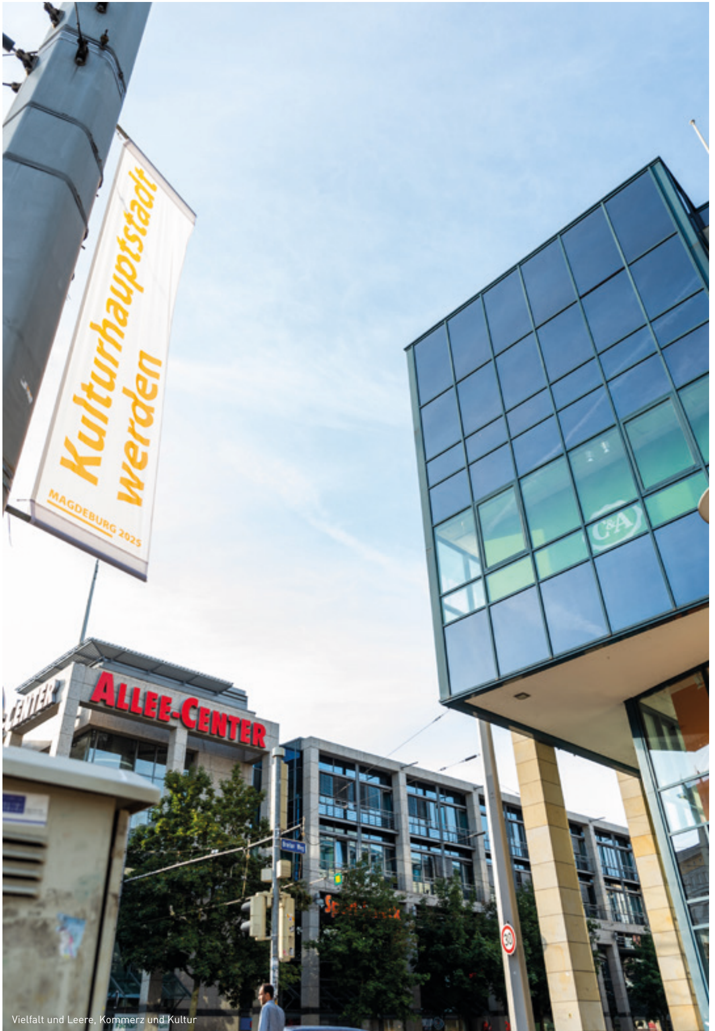
Vielfalt und Leere, Kommerz und Kultur