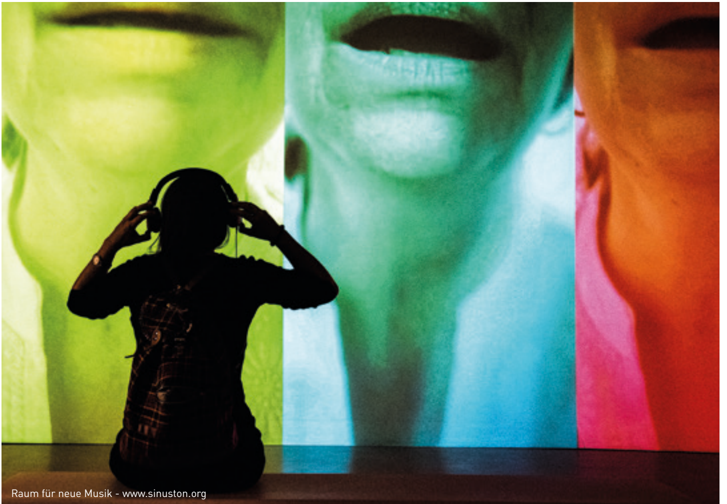
Raum für neue Musik - www.sinuston.org