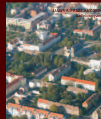
magdeburg radelnd erobern route 6

Unterwegs mit Rad und MVB www.magdeburg-radelnd-erobern.de