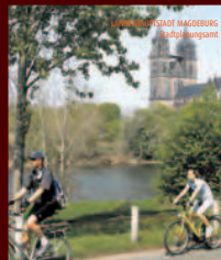
magdeburg radelnd erobern route 1

Magdeburg an der Elbe mit dem Fahrrad entdecken www.magdeburg-radelnd-erobern.de