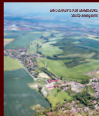
magdeburg radelnd erobern route 4

Beschaulicher Rundkurs durch die Elbauenlandschaft www.magdeburg-radelnd-erobern.de