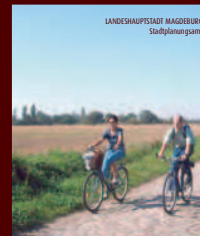
magdeburg radelnd erobern route 3

Das südöstliche Magdeburg zwischen Umflutkanal und Elbe www.magdeburg-radelnd-erobern.de