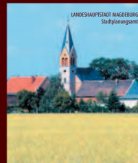
magdeburg radelnd erobern route 2

Magdeburg an der Elbe mit dem Fahrrad entdecken www.magdeburg-radelnd-erobern.de